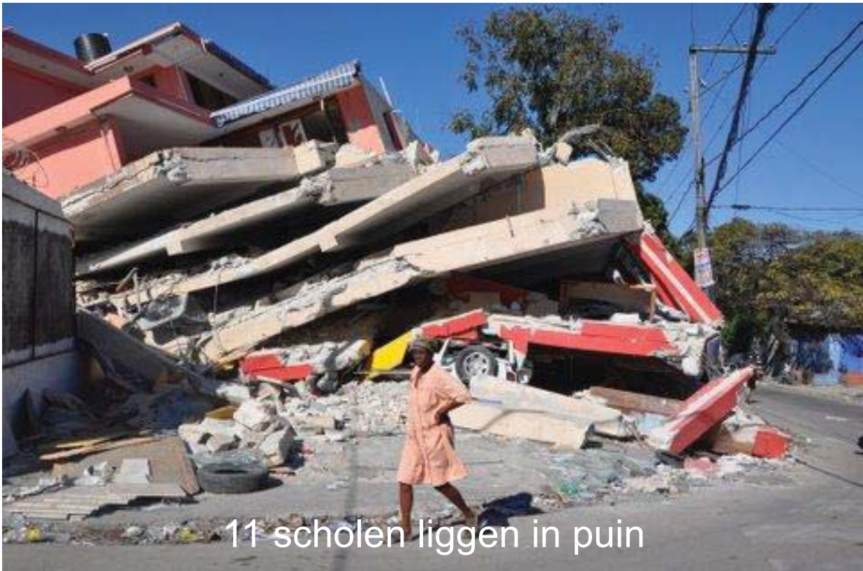
11 scholen liggen in puin