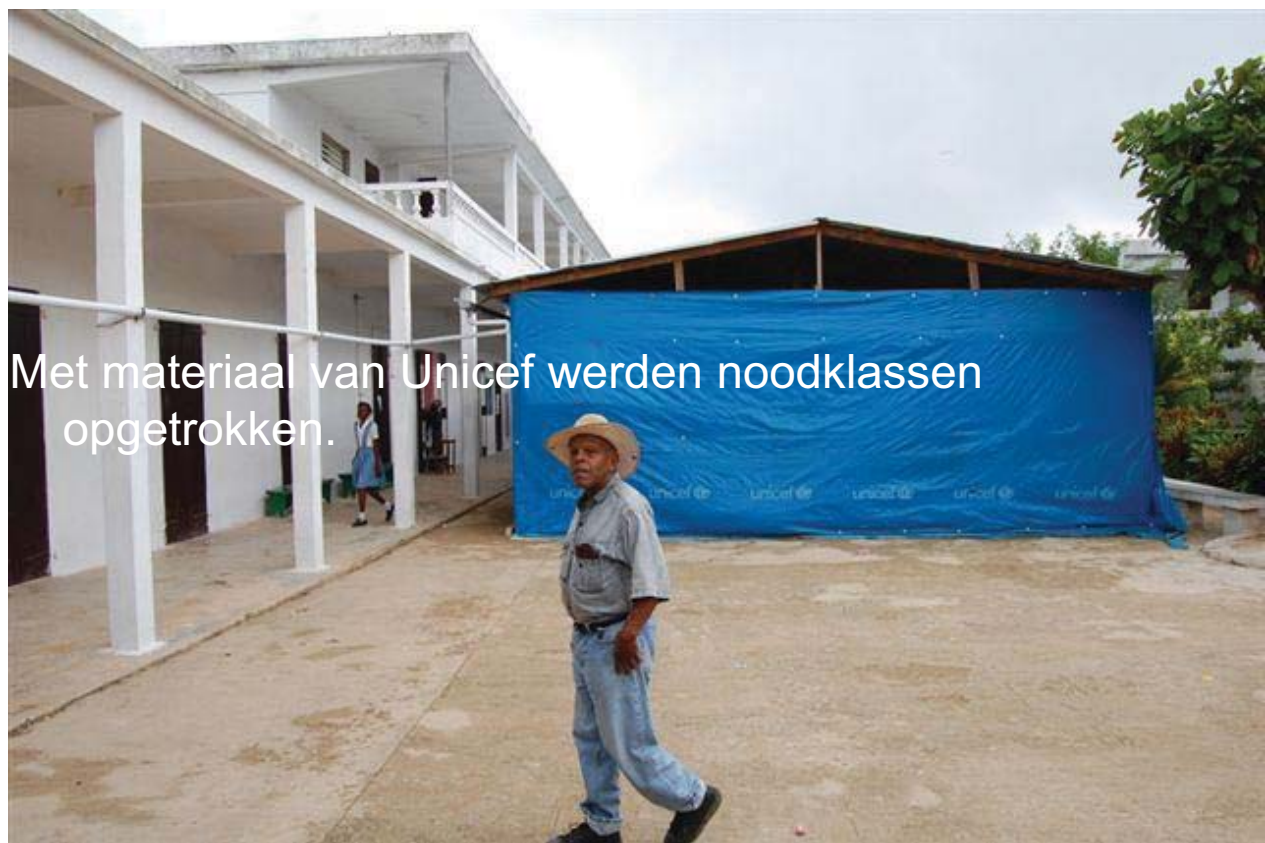
Met materiaal van Unicef werden noodklassen opgetrokken.