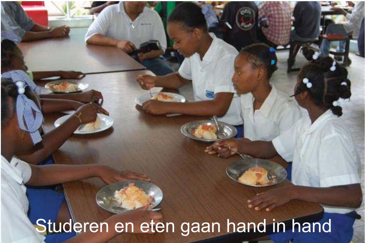
Studeren en eten gaan hand in hand