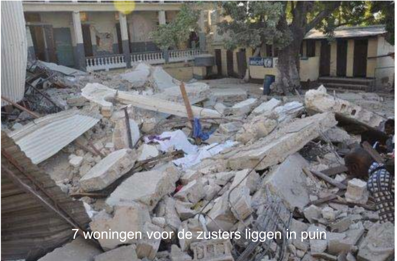
7 woningen voor de zusters liggen in puin