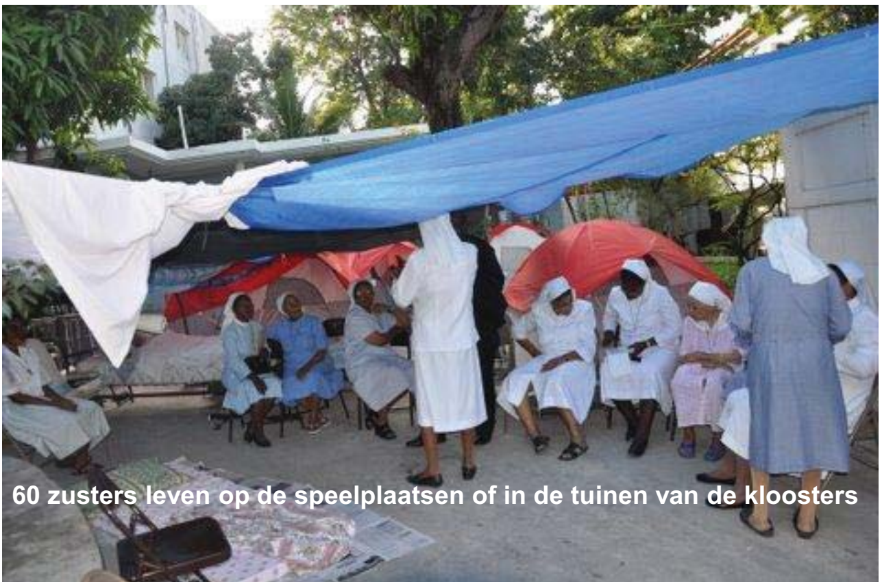
60 zusters leven op de speelplaatsen of in de tuinen van de kloosters